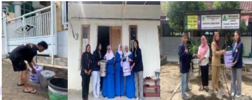
Gambar 3. Peletakkan Tong Sampah Organik dan An-organik

Dokumentasi ini memiliki beberapa fungsi strategis. Pertama, berperan sebagai sarana edukasi visual. Melalui foto dan narasi yang disebar, warga yang belum terlibat langsung dapat memahami manfaat program dan tertarik untuk berpartisipasi. Kedua, dokumentasi menjadi bentuk akuntabilitas bagi tim pengabdian, yang menunjukkan bahwa program dilaksanakan secara nyata dan transparan. Ketiga, dokumentasi juga berperan dalam membangun legitimasi sosial. Dengan melihat rekam jejak visual program, warga memperoleh bukti konkret bahwa kegiatan ini bermanfaat dan dapat dijalankan secara kolektif.