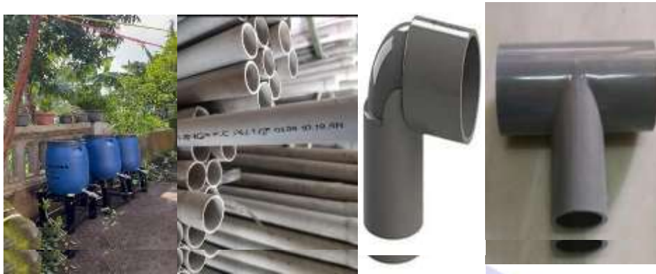
Gambar 2. Bahan Utama Pembuatan Komposter Sumber : Data primer (2025)

Model komposter ini tidak hanya dipahami sebagai sarana teknis, tetapi juga sebagai rekayasa sosial-budaya. Melalui kegiatan sosialisasi, masyarakat diperkenalkan pada konsep pemilahan sampah organik dan non-organik, serta diajak memahami bahwa sampah memiliki nilai ekonomis apabila dikelola dengan tepat. Dengan demikian, model yang ditawarkan tidak berhenti pada pemberian alat, tetapi juga menyertakan edukasi yang memicu transformasi perilaku masyarakat. Kesadaran baru ini mendorong terjadinya perubahan paradigma: dari memandang sampah sebagai limbah yang tidak berguna menjadi sumber daya yang bernilai guna.