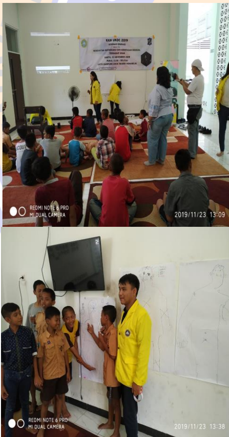
Gambar 1. Seminar Pendidikan Sex

mengajak anak-anak untuk mengikuti acara tersebut sangat sulit, karena pemahaman anak-anak tentang seminar itu merupakan suatu hal yang membosankan. Namun ketika kami membuat acara tersebut menyesuaikan dengan anak-anak yang tidak menyukai hal yang membosankan, anak-anak sangat menikmati. Pemutaran video ataupun permainan itu yang membuat anak-anak sangat menikmati acara tersebut. Semula anak-anak tidak mengetahui apa yang dimaksud dengan kekerasan seksual namun ketika permainan tersebut menggambarkan tentang tubuh manusia serta mengilustrasikan dalam bentuk permainan akhirnya anak-anak mengetahui kekerasan seksual. Serta dengan permainan lainnya anak-anak dapat mengetahui bahwa bagaimana cara mereka untuk menjaga anggota tubuhnya.