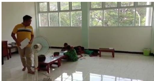
Gambar 4. Ruang belajar sebelum diperbaiki

karpet puzzle huruf sehingga dapat lebih nyaman untuk anak-anak di Kanri. Selain itu karpet huruf itu dapat digunakan sebagai media belajar mengenal huruf.