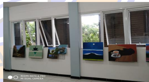
Gambar 3. Ruang Lukis yang sudah diperbaiki