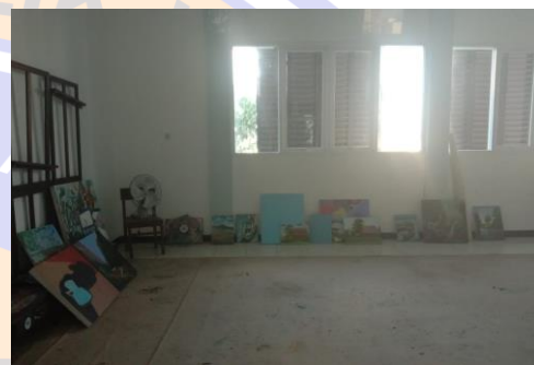
Gambar 2. Ruang lukis sebelum diperbaiki

Kegiatan perbaikan ruang lukis di Kampung Anak Negeri ini yaitu dengan menambahkan rak dalam ruangan lukis, agar lebih representatif untuk pengunjung ke Kampung Anak Negeri dan juga lebih rapi dalam meletakkan alat-alat melukis. Serta dengan ditambahkan rak besi yang diletakkan ditembok membantu anak-anak untuk display hasil lukisan anak Kanri. Sehingga anak dalam melukis mempunyai rasa bangga terhadap hasil karya mereka yang ditampilkan secara rapi.