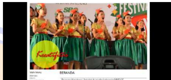
Gambar 2. Tampilan home page website sekolah

mobile maupun tampilan website memiliki skor performance yang kurang baik. Selain itu diperoleh fakta bahwa tim pengelola website sekolah saat ini belum memiliki pemahaman teknis dalam konten manajemen sistem website karena hanya sebatas post berita saja.