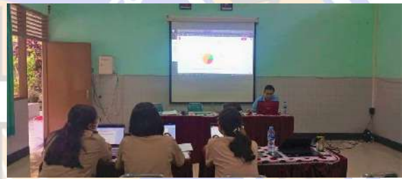
Gambar 5. Salah satu sesi pelatihan manajemen web

Dari hasil survei tersebut tim pengabdian merancang beberapa kegiatan berkelanjutan diawali dengan pelatihan dan dilanjutkan dengan pendampingan serta penerapan dasar konten manajemen sistem, merekomendasikan pembentukan ulang tim pengelola website dan kewenangan akses pada website . Dalam menjawab kebutuhan keterbatasan kemampuan tim tentang website , maka tim pengabdian memberikan saran menggunakan website berbasis open source yang cukup mudah dan praktis penerapannya yaitu wordpress .