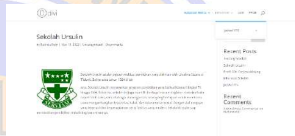
Gambar 7. Tangkapan layar post berita

Namun demikian setelah dilaksanakannya pelatihan nampak adanya peningkatan kemampuan tim pengelola website sekolah dalam menguasai dasar manajemen website sekolah, dimana hal ini nampak pada tabel post-test sebagai berikut