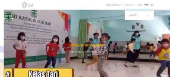
Gambar 6. Tangkapan layar homepage pelatihan

lambat dari peserta, hal ini disebabkan guru-guru yang menjadi tim juga sedang mempersiapkan kegiatan akreditasi sekolah yang dijadwalkan dan dilaksanakan pada bulan berikutnya.