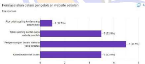
Gambar 4. Hasil kuesioner identifikasi permasalahan website

Untuk lebih menguatkan eksplorasi tentang tampilan website sekolah yang ada saat ini, maka tim pengabdian melakukan survei kepada orang tua wali murid dan alumni SDK Cor Jesu yang diisi oleh 55 responden, diperoleh data lebih dari 50% menyatakan jarang mengakses