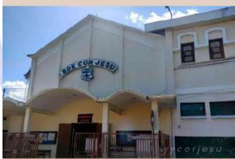
Gambar 1. Tampak depan gedung SDK Cor Jesu Malang

SDK Cor Jesu Malang sebagai salah satu sekolah tingkat dasar swasta ternama di kota Malang yang telah berdiri sejak tahun 1900 memiliki nilai historis yang tinggi, dimana gedung sekolah telah ditetapkan sebagai salah satu cagar budaya di Kota Malang dan menjadi ciri khas dalam bagian sejarah kota Malang.